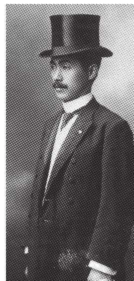
官僚時代の柳田國男

株式会社 七月社 ☎182-0015 東京都調布市八雲台 2-24-6 電話 / FAX : 042-455-1385